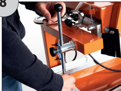
Motorkopf mit dem Hand- knebel sicher fixieren und Kne- belkopf fest verschrauben