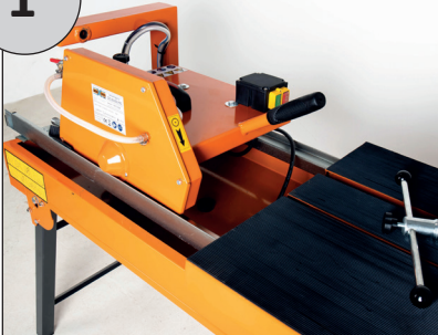
Ausgangssituation: Abmontierter Motorkopf