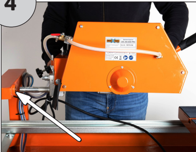
Bolzen des Motorkopfes in die vorgesehene Bohrung einführen