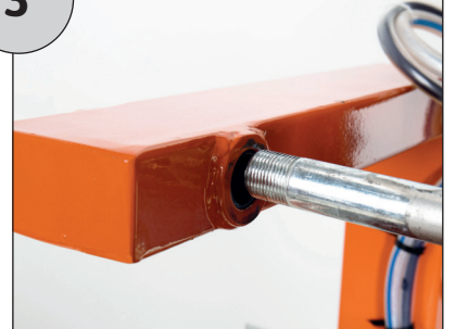
Vorgesehene Bohrung für Bolzen nutzen