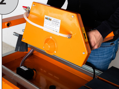
Anheben des Motorkopfes