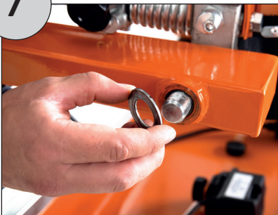
Unterlegscheibe auf Bolzen setzen